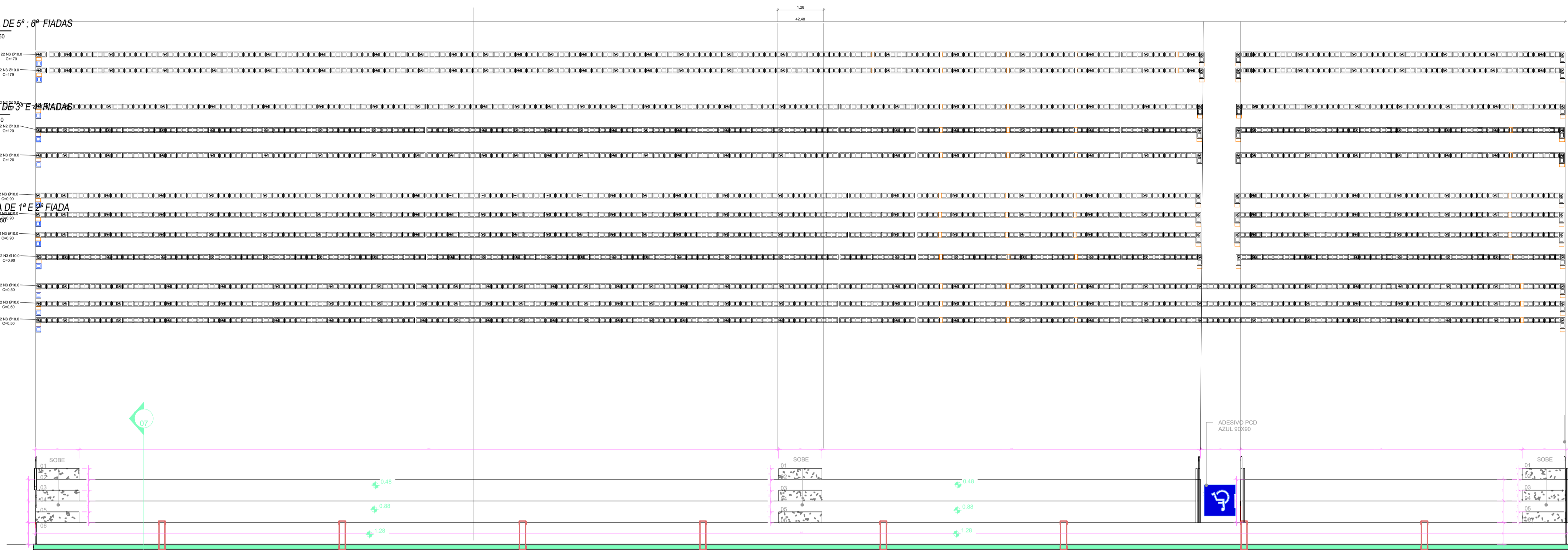
02 PLANTA DE 1ª E 2ª FIADA ESCALA: 1:50