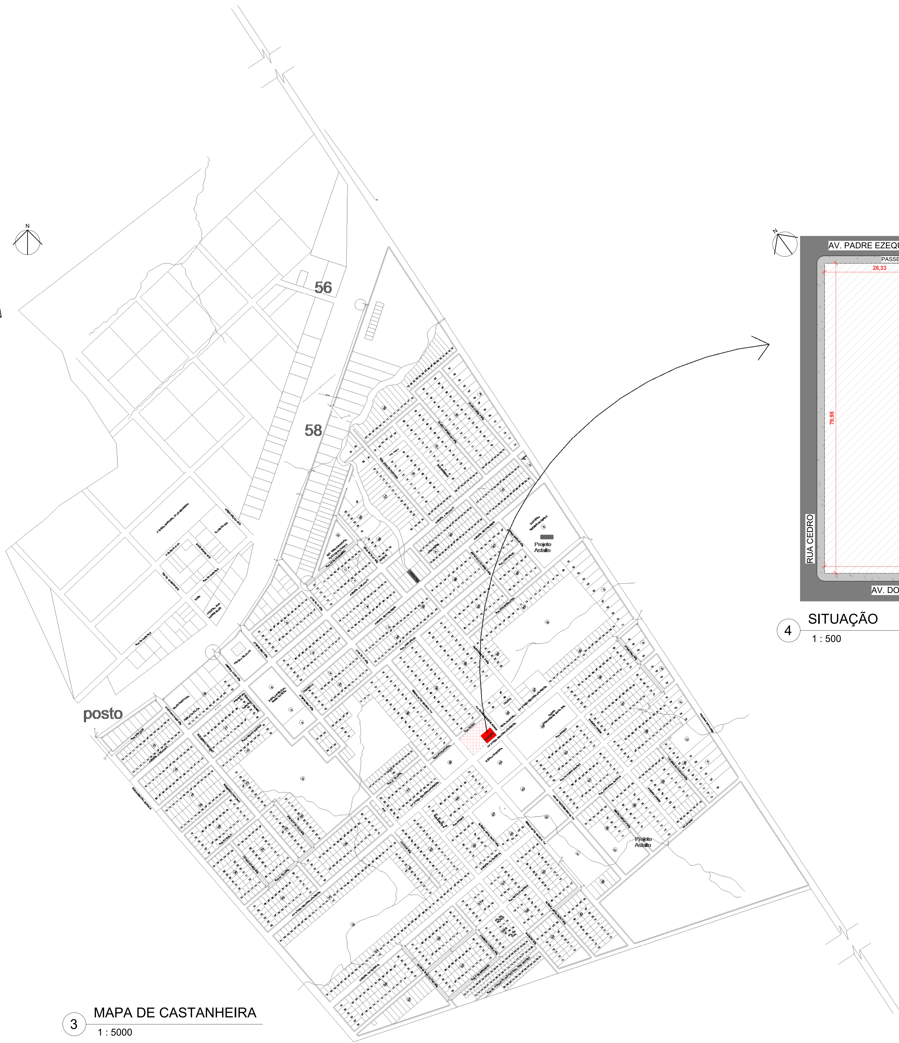
4 SITUAÇÃO 1 : 500